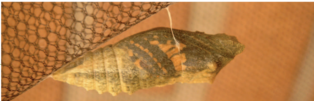
Gordelpop van de Koninginnenpage.