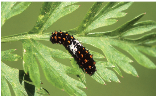
Rups Koninginnenpage (stadium L3).

De rups eet flink door en zal meerdere keren vervellen en wordt daarbij telkens wat groter. De grotere rupsen vallen dan weer vooral ten prooi aan vogels: tot tweederde van de overblijvende rupsenpopulatie wordt opgegeten.