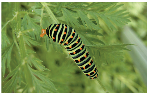
Rups Koninginnenpage met osmaterium.

Na de derde vervelling krijgen de rupsen een zeer opvallend patroon met een groene grondkleur én op elk segment een zwarte band en oranje vlekken. Zo vallen ze heel fel op. Het is in dat stadium dat de rups op de tuinworteltjes dan ook gemakkelijk te vinden is. Dit is een uitgelezen moment voor een tweede dagvlinder tuintip: door het aanplanten van worteltjes, uiteraard puur natuur, maak je een reële kans dat je dit allemaal kan meemaken in je moestuintje.