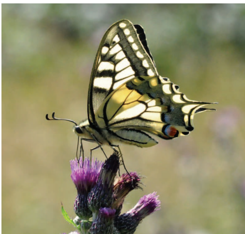
Koninginnenpage op kale jonker.

Al is de vlinder slechts zelden talrijk te zien toch kennen heel wat mensen deze opvallende verschijning bij naam. Weinigen kunnen trouwens onberoerd blijven bij deze prachtige soort. Het is niet alleen onze grootste dagvlinder maar zeker ook één van de mooiste qua vorm en kleuren. De opvallende gele kleur in contrast met de donkere tekening en de lange staarten aan het uiteinde van de achtervleugels geven deze vlinder een exotische toets. Het mannetje en wijfje zijn qua tekening volledig vergelijkbaar maar de wijfjes zijn gemiddeld wel groter.