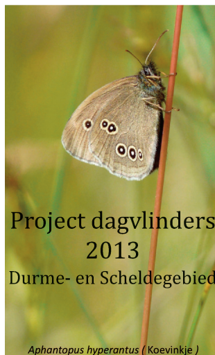
Kaart: VVE WG Dagvlinders

Project dagvlinders 2013 Durme- en Scheldegebied